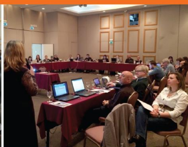
Athens, 26-27 February 2015