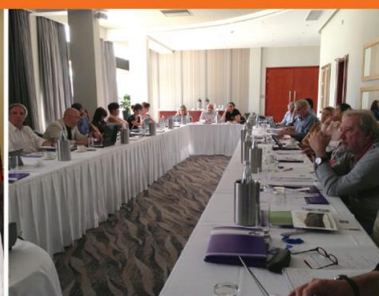
Malta, 23-24 October 2014